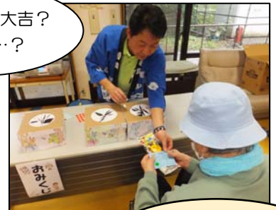
おみくじコーナー