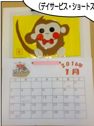
▲干支の申をモチーフに