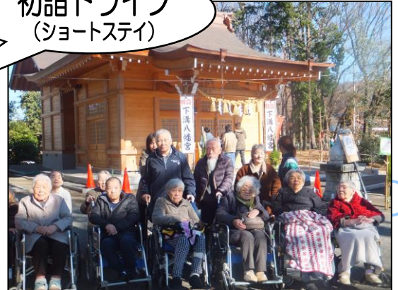
▲元日に下溝八幡宮へ初詣に出掛けました！！