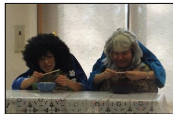
▲二人羽織でそばを食べます

今年は、ショートステイ職員による、よさこいとデイサービス職員による、二人羽織が披露され、その絶妙な仕上がり に会場からは、大きな歓声と拍手が上がっていました!!