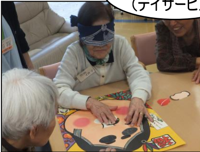
▲目隠しを取った時に大笑い？