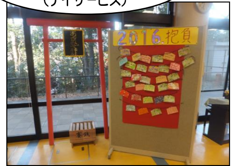
▲デイサービスフロアに神社が登場