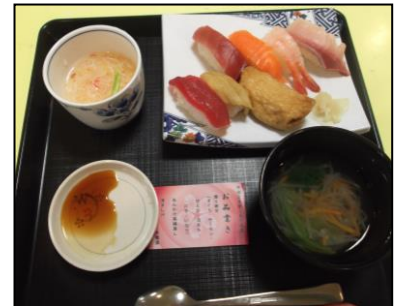
▲見た目も華やかで美味しそう

年に1回の特別なメニューとあって、ご利用の皆さんには大変喜んでいただけました!!