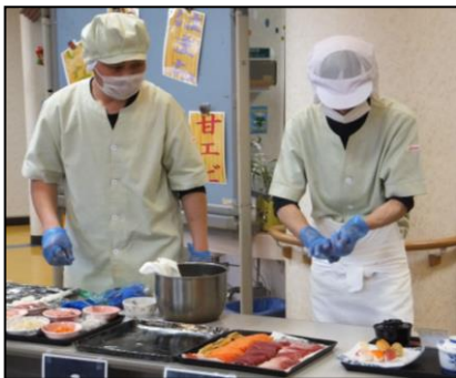
▲握り立てのお寿司は格別です!!