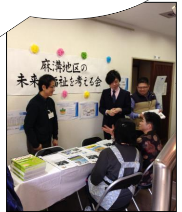
▲福祉に関する質問や相談も

3月6日(日)に行われた麻溝公民館まつりに「麻溝地区の未来の福祉を考える会」として参加し、広報活動を行いました!!