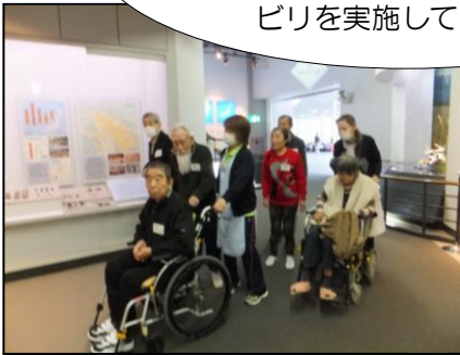
▲市立博物館で展示を觀賞しながら

デイサービスでは、より効果的に機能訓練を行う為、定期的に施設外でのリハビリを実施しています。