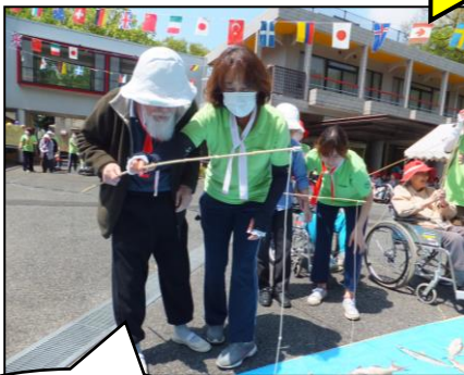
「魚釣りリレー」 釣竿をバトン替りに してリレーをします