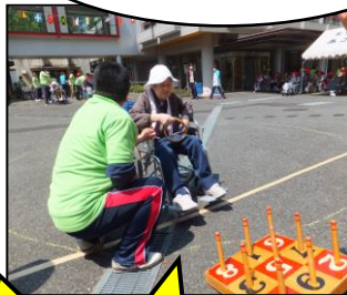
「輪投げリレー」 輪が入ったら次の走者に バトンタッチ。焦るとなか なか輪が入らない!!