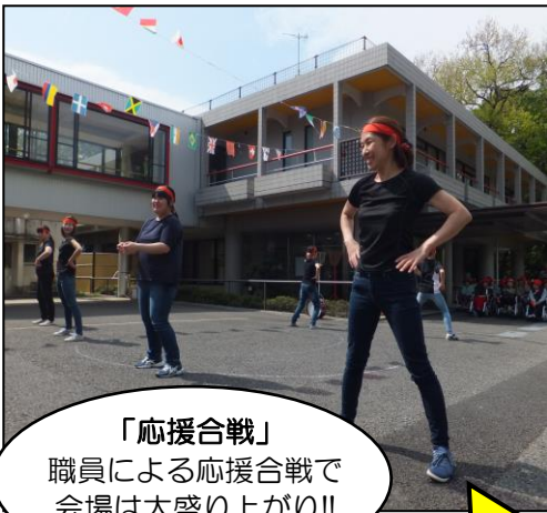
「応援合戦」 職員による応援合戦で 会場は大盛り上がり!!