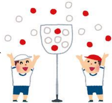
「鈴割り」 鈴を早く割った方の勝ち。 今回の勝者は…?