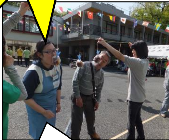
「パン食い競走」 ここで取ったあんぱんが 当日のおやつになりました!!