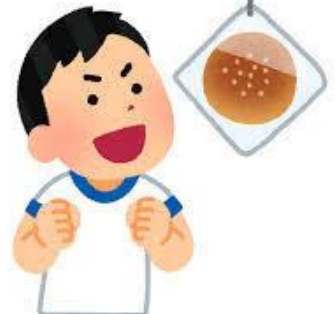
天候に恵まれた中で 無事に開催出来ました!! 皆様、お疲れ様でした!!