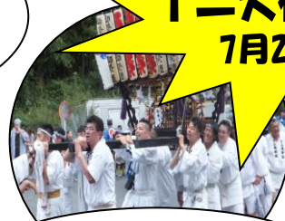
施設の中庭におみこしが来ました!!