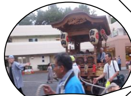
山車の迫力に会場から歓声が!!