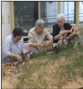
▼皆さん真剣に作業中!!

7月と言えば、やっぱり七夕ですよ!!今年も、デイサービス、ショートステイのご利用者と一緒に七夕飾り作りを行いました!!折り紙を使って、盛大に飾り付けられ笹に、仕上げとして、皆さんの願い事を書いた短冊を下げて完成となりました。色とりどりの折り紙と短冊で飾り付けがされた、笹は各フロアを華やかにしてくれました!!皆さんの願い事が叶います様に!!