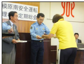
▲これからも安全運転継続を!!

6月14日(水)に相模原南警察署で行われた、相模原南安全運転管理者会総会内で、当法人職員3名が優良運転者表彰を受けました。この表彰は事業所に3年以上運