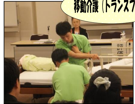
▲ベッドから車椅子への移動を介護