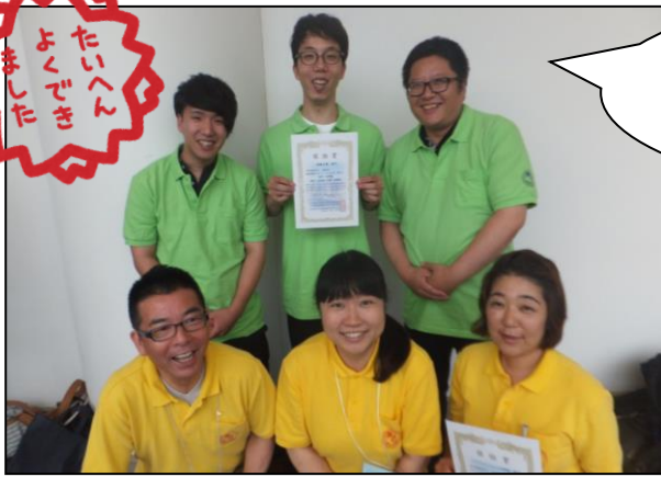
▲無事に発表が終わって—安心(?)お疲れ様でした!!