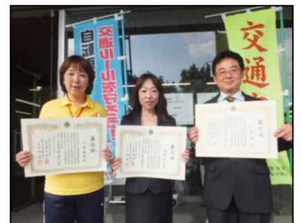
▲表彰状と記念品をいただきました