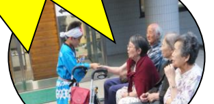
ご利用の皆さんも大喜びでした!!