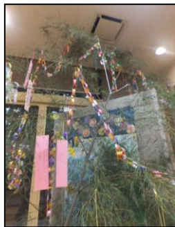
▲七夕ムード満点です